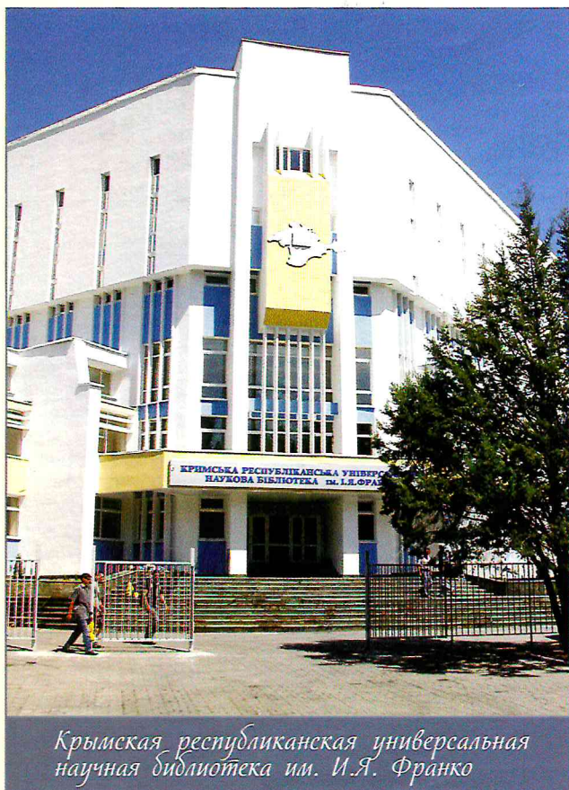
Крымская республиканская универсальная научная библиотека им. И.Я. Франко

сальной научной библиотеки им. И.Я. Франко, являясь методическим центром для общедоступных библиотек республики, провел в первой половине 2017 г. социологическое исследование « Специалист XXI века: изучение кадрового потенциала библиотек Республики Крым ».